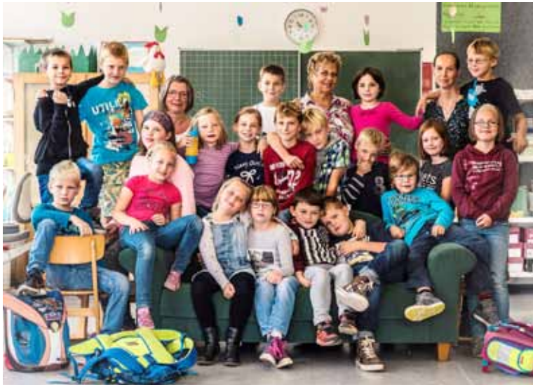
Inklusion-Plakatmotiv - ©Thomas Binn

Den 23. Mai 2017 sollten sich Eltern, Lehrer und alle Interessierten vormerken. Um 19.30 Uhr heißt es „Film ab“ für den Dokumentarfilm „Ich. Du. Inklusion“. Ob Köln, Hamburg oder Berlin - der Film ist am 4. Mai bundesweit in die Kinosäle eingezogen. Thomas Binn, Sozialpädagoge und Filmemacher aus Kevelaer, beleuchtet und dokumentiert die Integration von unterstützungsbedürftigen Kindern in deutschen Schulen seit 2014.