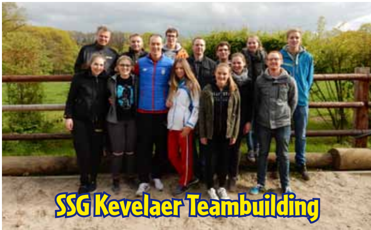
SSG Kevelaer Teambuilding