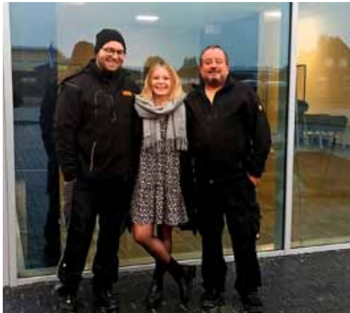
Reifencenter Sonsbeck feiert Eröffnung des neuen Standorts, Alpener Straße 20 (weiter Seite 12)

Die UZ wünscht den Lesern ein fröhliches Helau!