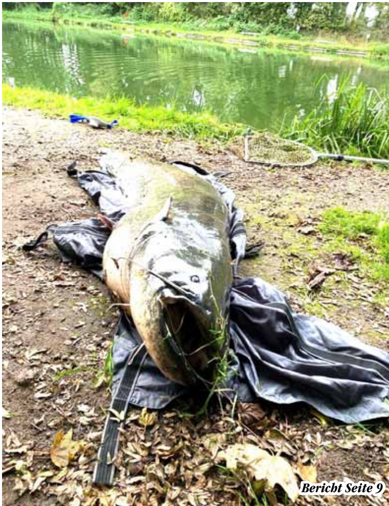
Bericht Seite 9

eines 2,30 m Wels im Sonsbecker Angelpark