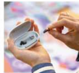
Modernes, maximal diskretes Design

„Mit dem Silk Charge&Go IX erfüllen wir jetzt einmal mehr