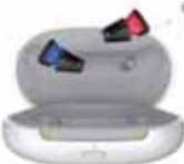
Silk Charge&Go IX

Das muss gar nicht sein. Denn heutzutage haben Hörgeräte nichts mehr mit den klöbigen Hörhilfen von früher zu tun. Längst sind sie zu wahren Wunderwerken in Miniaturform geworden. Eines der kleinsten auf dem Markt ist das Silk von Signia. Jetzt bringt der Erlanger Hörgerätehersteller eine neue Generation des Silk heraus, die noch näher an dem dran ist, woran wir uns mittlerweile bei elektronischen Geräten gewöhnt haben: Einfaches Aufladen statt umständlichem Batteriewechsel. Denn mit Silk Charge&Go IX präsentiert Signia das Gerät auch als wiederaufladbare Akku-Variante.