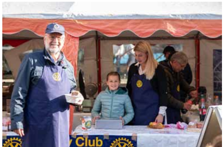
Am Stand der Rotarier Xanten

Das Bürgerservicebüro der Stadt Xanten bietet ab dem 17.10.2023 jeden Dienstag zwischen 8 und 12 Uhr Sprechzeiten ohne vorherige Terminvereinbarung an. Eine Terminbuchung ist ab diesem Zeitpunkt dienstags nicht mehr möglich. Die Verwaltung weist darauf hin, dass es bei freien Sprechzeiten zu Wartezeiten kommen kann.