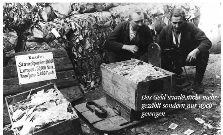
Das Geld wurde nicht mehr gezählt sondern nur noch gewogen

Auch beim 850jährigen Jubiläum des Dorfes Keppeln am 2.9.23 waren die Musiker*innen der Spielgemeinschaft wieder dabei und trugen mit einigen Märschen und Unterhaltungsmusik zum Gelingen des Festaktes bei.