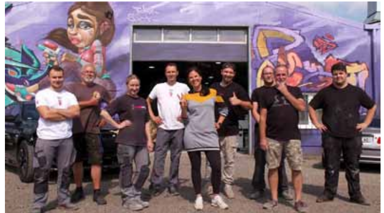
© Zellmannfilm & Medien GmbH, Mike Püllen und sein STARLACK-Team

Ein lokaler Unternehmer, der regelmäßig in der DMAX-Serie „Sidneys Welt“ und in einer Sendung im RTL II-Format „Grip“ zu sehen war, ist auch keine alltägliche Sache.