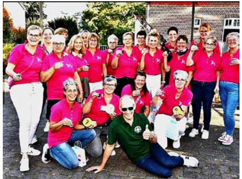
Die Landfrauen Labbeck haben im Zuge des Schützenfestes am Gemeindeparkschießen teilgenommen, wobei 12 Mannschaften teilnahmen und sie drei Preise gewonnen haben. Und zusätzlich wurden die Gäste noch mit selbst gebackenem Kuchen, als auch mit Crepes versorgt.

verstorbene Angehörige haben. Für sie war traurig nicht nur dunkel, deswegen haben sie helle Sterne dazu gemalt. Ein besonderer Ort ist die Gedenkstätte für Sternenkindereltern. Als Sternenkinder werden Babys bezeichnet, die vor, während oder kurz nach der Geburt sterben. Die Bepflanzung des Sternfeldes ist so angeordnet, dass immer etwas Blühendes zahlreiche Insekten anziehen wird und somit viel Gesumme und Leben dort stattfindet. Die Beschriftung der Steele zeigt die bleibende Liebe, die Mütter und Väter spüren, auch wenn sie in der Frühschwangerschaft ihr Kind verlieren. Jetzt können sie auch dort beerdigt werden. Die Reihenfolge der einzelnen Trauerwegs-Punkte spielt keine Rolle, alle sind eingeladen, ganz nach den eigenen Bedürfnissen die Punkte des Weges aufzusuchen und zu nutzen. Der Trauerweg versteht sich als Beitrag zu einer offenen und sehr persönlichen Trauerkultur, die die Kirchengemeinde St. Maria Magdalena in ihrer Gemeinde und darüber hinaus pflegen möchte. Er wendet sich an Trauernde und ihre Angehörigen, Jung und Alt und alle Interessierten, unabhängig von Religion, Konfession und Weltanschauung. Der Trauerpfad kann allein oder mit anderen begangen werden. Zugang hat man über den Parkplatz am Bögelschen Weg, neben der Friedhofshalle, sowie der Zufahrt zur Gereberns Kapelle. Nähere Informationen zum Sonsbecker Trauerweg: https://www.katholisch-sonsbeck.de/kirchen-treffpunkte/der-trauerweg .