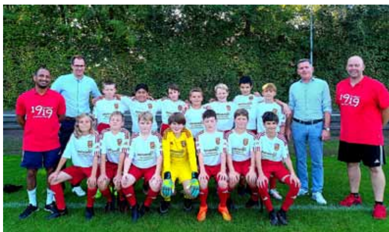
Die Provinzial Versicherung aus Sonsbeck, Giesen & Wehren hat der D3 Jugend des SV Sonsbeck neue Trikots gesponsert