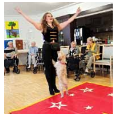
Zirkus im Katharinen-Haus – Viel Freude für die Seniorinnen und Senioren

niorinnen und Senioren, der noch lange in Erinnerung bleiben wird.