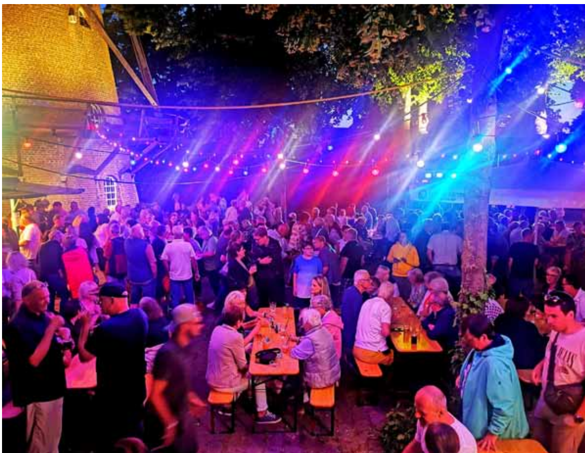
Ein herrlicher Freitagabend am 16. Juni, war die Kulisse für ESSEN - TRINKEN - FRÖHLICH SEIN bis 02.00 Uhr in der Nacht

Heimat- und Verkehrsverein Sonsbeck e. V.