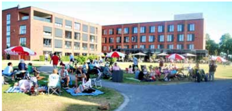
An dem sehr heißen Samstag durfte man der Musik lauschen, eigene oder vom Hotel Rilano verkaufte Getränke genießen und gemütlich auf seiner Decke weilen.

MAN KANN NICHTS UNGESCHEHEN MACHEN. ABER MAN KANN ANFANGEN, ES ANDERS ZU MACHEN.