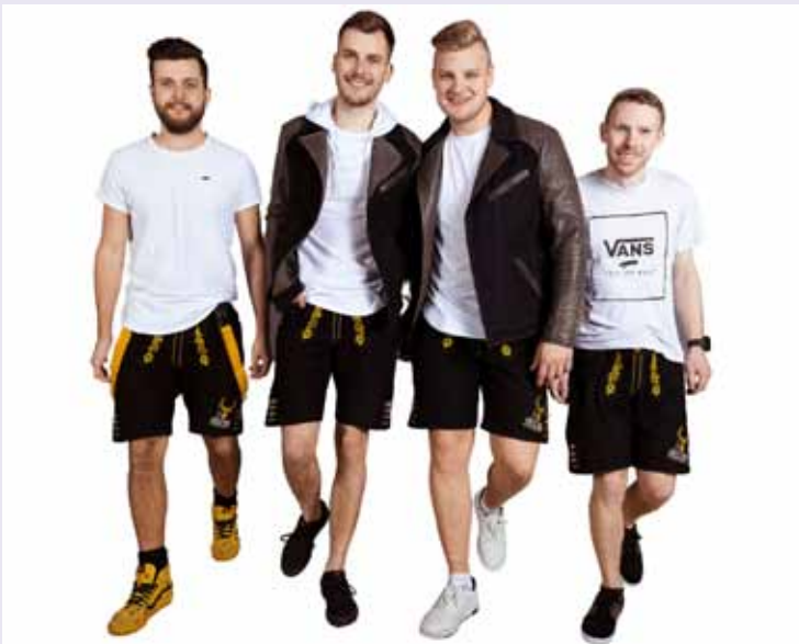
Die Gruppen Brings und Partyhirschen finden auch den Weg nach Xanten

Darüber hinaus veranstaltet das Freizeitzentrum Xanten noch weitere Veranstaltungen in der Saison 2023. Alle Termine und Infos unter www.f-z-x.de .