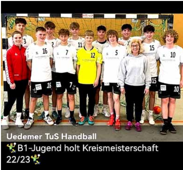
Uedemer TuS Handball B1-Jugend holt Kreismeisterschaft 22/23