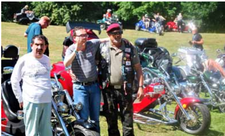
In Sonsbike war mal wieder kräftig was los... Und viele Menschen konnten wieder mal glücklich gemacht werden

T-Shirts, Tassen und andere Druck- und Werbeprodukte