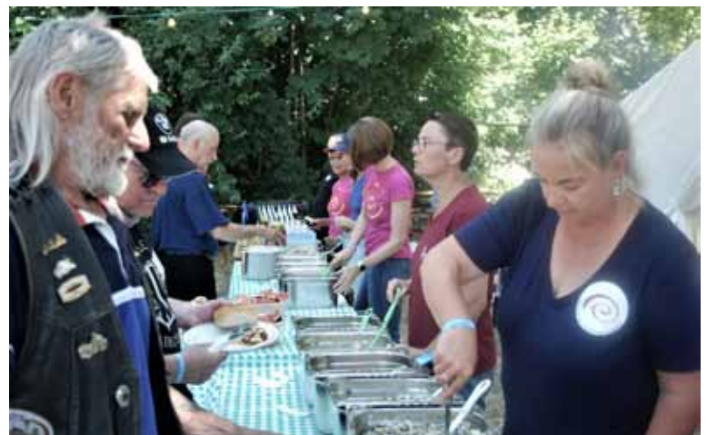
Die freiwilligen Helfer bei der Essens- und Getränkeausgabe