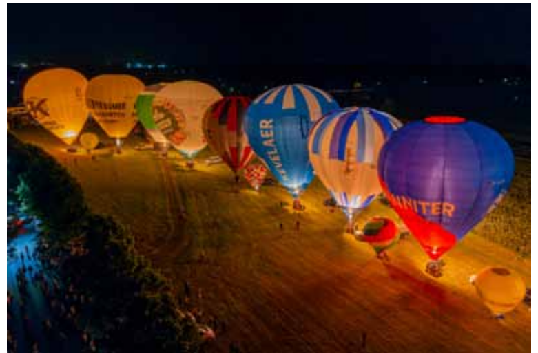
Das „Heißluft-Ballon-Festival“ lockt am 7. und 8. Juli 2023 wieder zahlreiche Besucher mit einem tollen Rahmenprogramm in die Wallfahrtsstadt Kevelaer

Mit den Hubschrauber Rundflügen wurde im vergangenen Jahr ein begehrter Programmpunkt in das Festival integriert. Auch im Jahr 2023 wird es daher möglich sein wieder Tickets für einen Rundflug über die Wallfahrtsstadt im Helikopter zu ergattern.