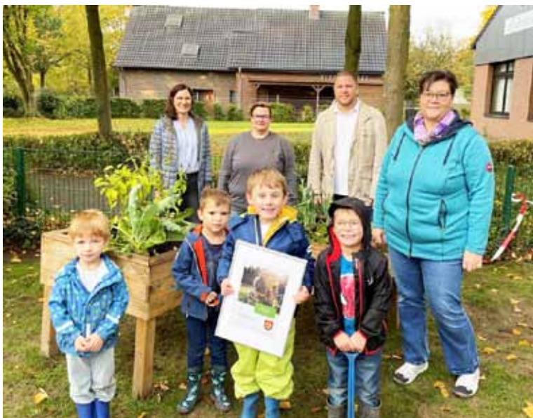
In 2022 gewann der St. Marien Kindergarten den Westenergie Klimaschutzpreis für seinen Beitrag zur Biodiversität

Seit 1995 macht der Westenergie Klimaschutzpreis regelmäßig zahlreiche gute Ideen und vorbildliche Aktionen aus dem lokalen und regionalen Umfeld für die Öffentlichkeit sichtbar. Er regt damit auch zum Nachahmen an und macht Mut, selbst aktiv zu werden. Insgesamt erhielten bereits mehr als 8.000 Projekte die Auszeichnung. Der Preis wird in den Städten und Gemeinden jährlich ausgelobt und kann für den ersten Platz bis zu 2.500 Euro betragen. In Sonsbeck ermittelt Westenergie seit 2018 die Klimaschutzhelden des jeweiligen Jahres. Die Gewinnerinnen und Gewinner ermittelt eine Jury aus Vertreterinnen und Vertretern der Kommune und von Westenergie.