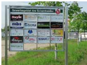
Hinweistafel Am Schankweiler

Die Hinweistafeln ermöglichen nun sowohl den Besuchern und Lieferanten als auch den Kunden eine einfache Orientierung in dem jeweiligen Gewerbegebiet.