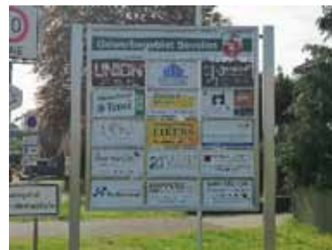
Hinweistafel Vorster Heidweg