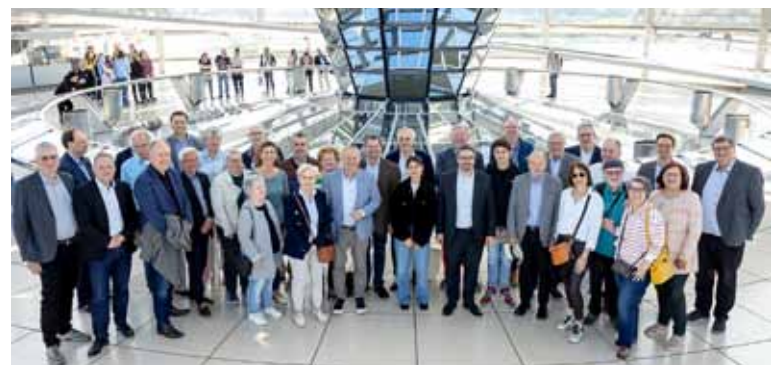
Bundestagsabgeordneter Stefan Rouenhoff in der Kuppel des Reichstagsgebäudes mit den Mitgliedern des Presseclub Kleve

im Reichstagsgebäude inklusive der Teilnahme an einer Plenarsitzung für die Mitglieder des Presseclubs auf der Tagesordnung. Die Debatte über einen Antrag der CDU/CSU-Frakturen für eine sichere, bezahlbare und klimafreundliche Wärmeversorgung ohne soziale Kälte konnte live von der Zuschauer-Tribüne verfolgt werden und bot einen Blick hinter die Kulissen der Politik im Reichstagsgebäude. Im Anschluss daran folgte eine Diskussionsrunde mit dem CDU-Abgeordneten Stefan Rouenhoff. Dieser berichtete von aktuellen Herausforderungen der derzeitigen politischen Lage. Die folgende Frageunde nutzten die Mitgereisten, um den aus dem Kreis Kleve stammenden Politiker auf regionale Themen anzusprechen, bevor sie gemeinsam die Kuppel des Reichstagsgebäudes besichtigten. Ebenfalls auf dem Programm stand eine Führung im Dokumentationszentrum NS-Zwangsarbeit in Schöneweide. Dort erfuhren die Teilnehmenden Wissenswertes über die Geschichte der NS-Zwangsarbeit, verbunden mit Einblicken in die Schicksale der Menschen der damaligen Zeit. Mit vielen neuen Eindrücken und spannenden Informationen aus der Hauptstadt kehrten die Mitglieder des Presseclub Kleve e.V. in den Kreis Kleve zurück. So viel ist sicher: Diese Reise wird noch lange Thema bei den Presseleuten sein.