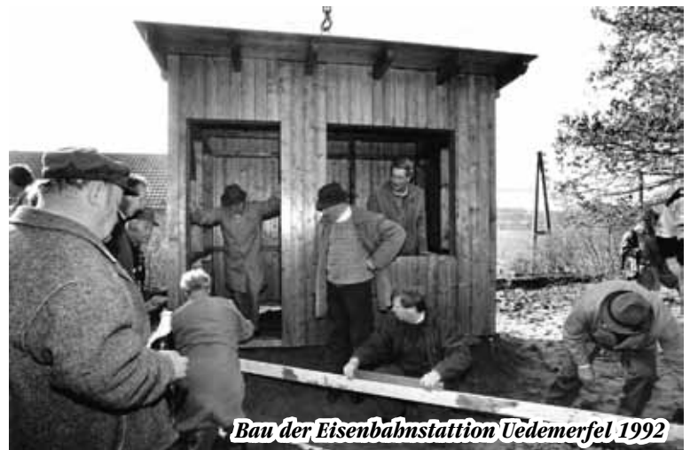
Bau der Eisenbahnstation Uedemerfel 1992