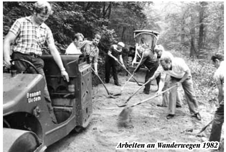
Arbeiten an Wanderwegen 1982

Keppeln den berühmten Stein und die Windmühlen, für Uedemerbruch den Tunnel und die Radarkugel im Hochwald, sowie für Uedemerfeld einen Bauernhof und eine Kuh. Zur Geschichte des Vereins ist eine Festschrift von annähernd 300 Seiten mit zahlreichen Fotos erschienen, dabei werden auch die Untergruppen wie Mundartgruppe, Geschichtskreis und Mühlenteam besonders beachtet. Die Festschrift ist für 20 € sonntags in der Hohen Mühle erhältlich. Derzeit läuft auch eine Bilderausstellung zur Vereinsgeschichte in der Hohen Mühle, die an Sonntagen von 14.00 bis 16.30 Uhr besichtigt werden kann.