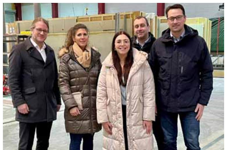
Bürgermeister und Wirtschaftsförderung besuchen die Petershaus GmbH & Co. KG in Kevelaer