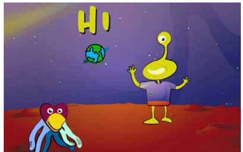
Außerirdische Planetenforscher sind für die Klimaolympiade in der Johann-Hinrich-Wichern Gemeinschaftsgrundschule Sonsbeck gelandet!

Hochstraße 52 • 47665 Sonsbeck • Fax: 0 28 38 | 96 882 Mail: kontakt@bestattungen-peters.info | www.bestattungen-peters.info