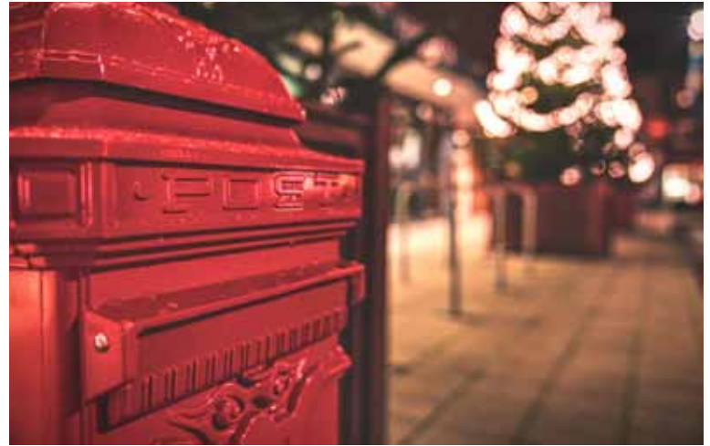
Hoffnung geben in schwierigen Zeiten