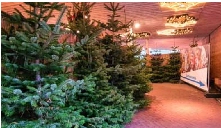
Vom 20. bis 22. Dezember werden in der Museumspassage die schönsten Tannenbäume des „Kevelaerer Krippenmarktes“ für einen guten Zweck verkauft