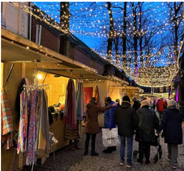
Krippenmarkt Aussteller und Gastro Meile

markt“ statt, der zum Besuch einlädt. Zudem kann der Brief per Post an das Christkind im Rathaus, Peter-Plümpe-Platz 12 in 47623 Kevelaer, gesandt werden. Wer möchte, schickt seinen Brief ganz umweltfreundlich und kostenlos per E-Mail an christkind@kevelaer.de und erhält die Antwort auf Wunsch auch auf diesem Wege. Wer die Antwort des Christkinds per Post nach Hause geschickt bekommen möchte, kann die Adresse mit vollständigem Namen in der E-Mail angeben. Alle fleißigen Schreiber dürfen sich auf eine persönliche Antwort des Christkinds freuen. Dafür darf natürlich die Antwortadresse nicht fehlen.