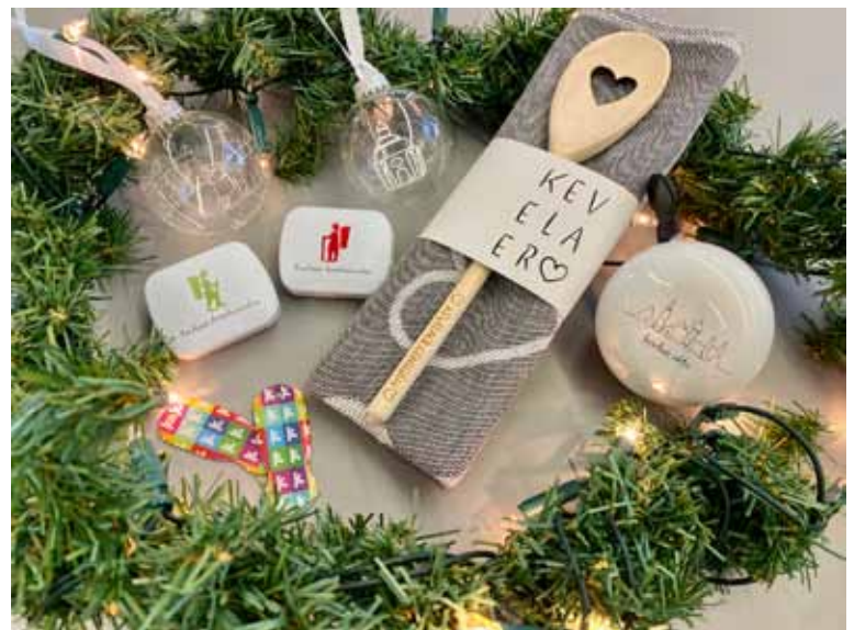
Das Kevelaer Marketing bietet eine Vielzahl an Produkten an, die die Augen von jedem Kevelaer-Fan leuchten lassen.

schirrtuch und Kochlöffel angeboten. Weitere neue Produkte Auch in diesem Jahr haben es wieder einige neue Produkte in das Sortiment geschafft. Neben der im letzten Jahr erschienenen Weihnachtskugel mit dem Motiv der Gnadenkapelle, setzt sich die Reihe nun mit dem Gradierwerk fort. So kann man sich ein Stück Kevelaer in den Weihnachtsbaum hängen. Auch für Radfahrer hat sich die Produktpalette mit einer Klingel erweitert. Zudem erhält das Kevelaerer Anpelmännchen so langsam Einzug ins Sortiment. Neben Pfefferminzdöschchen sind nun auch Postkarten mit dem entsprechenden Motiv erhältlich. Für regnerische Tage gibt es nun auch zwei verschiedene Regenschirme im Angebot. Nach wie vor sind verschiedene Bestandsprodukte wie Tassen oder Schlüsselanhänger verfügbar. Erhältlich sind alle Produkte zu den bekannten Öffnungszeiten in der Tourist Information oder ganz bequem online im Webshop des Kevelaer Marketings.