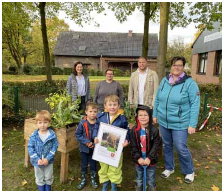
Die Gewinner*innen des St. Marien Kindergartens in Sonsbeck freuen sich über den Erhalt des Westenergie Klimaschutzpreis

Zudem ermittelt Westenergie seit 2018 den Klimaschutzhelden des jeweiligen Jahres. Aus drei außergewöhnlich gelungenen Ideen stimmt das Publikum per Online-Wahl über das Gewinnerprojekt ab.