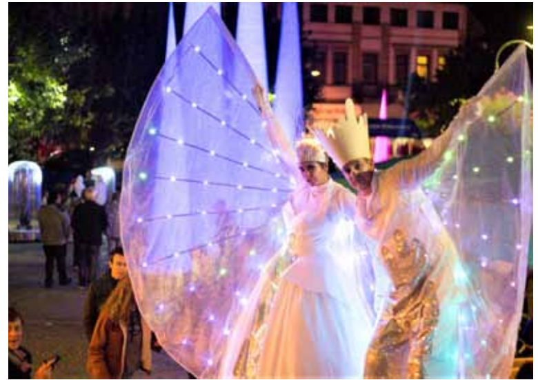
In den Straßen der Kevelaerer Innenstadt sind beim „Zauberhaften Kevelaer“ mystische Walking Acts unterwegs, die begeistern