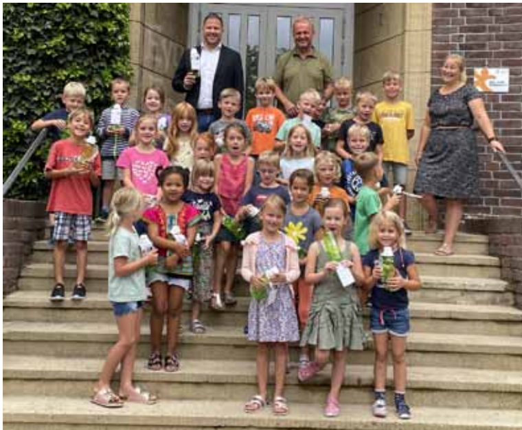
Die Erstklässlerinnen und Erstklässler der Wilhelm-Koppers-Schule Alpen-Veen freuen sich über Trinkflaschen von Westenergie