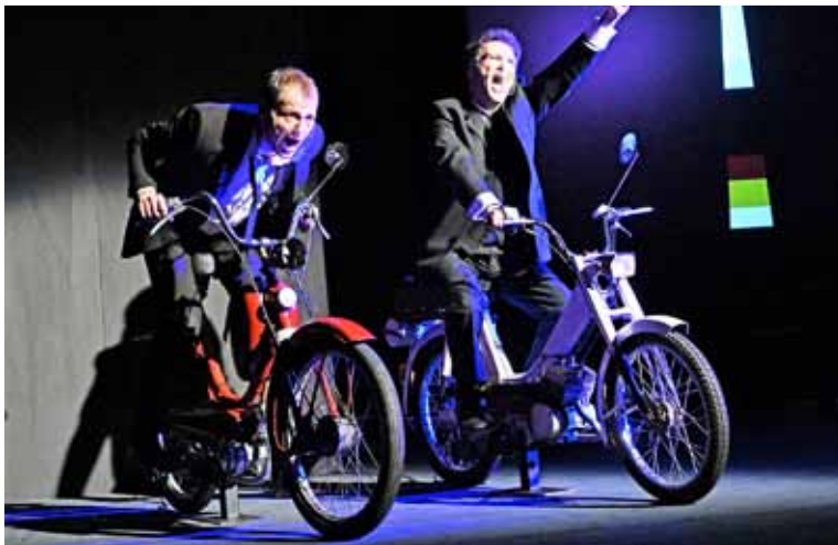
1. PI Theater 25 km/h „25 km/h“ eröffnet am Dienstag, 27. September, die Theaterspielzeit im Konzert- und Bühnenbau

hat, hat Christian als Geschäftsmann eine erfolgreiche Karriere gemacht. Die ausgeprägten Animositäten werden am Abend im gemeinsamen Elternhaus mit Hilfe großer Mengen Alkohols einigermaßen erfolgreich verdrängt. Zumindest so weit, dass die beiden beschließen, die gemeinsame Moped-Tour durch Deutschland zu machen, die sie mit 16 verabredet hatten. Und zwar sofort und mit allen einst vereinbarten Sonderaufgaben. In ihren Beerdigungsanzügen und alles andere als nüchtern machen sie sich noch in der Nacht auf den Weg. Die Höchstgeschwindigkeit beträgt 25 km/h. Es ist der Trip ihres Lebens! Eintrittskarten für die Bühnenfassung des bekannten Spielfilms „25 km/h“ können in der Tourist Information im Erdgeschoss des Rathauses, Peter-Plümpe-Platz 12, 47623 Kevelaer oder online im Ticketshop unter www.kevelaer-tourismus.de , erworben werden. Für die diesjährige Spielzeit können auch noch Theaterabonnements abgeschlossen werden. Darin enthalten sind alle sieben Theaterstücke.