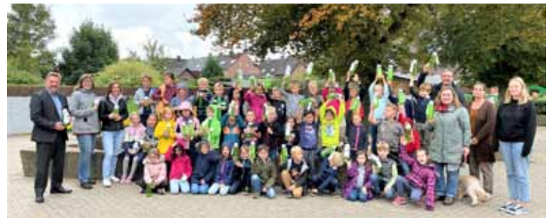
Die Erstklässlerinnen und Erstklässler der Brüder-Grimm-Schule und der St. Nikolaus-Schule in Issum freuen sich über Trinkflaschen von Westenergie

Gemeinde Issum und Westenergie begrüßen Erstklässlerinnen und Erstklässler zu ihrem Schulstart