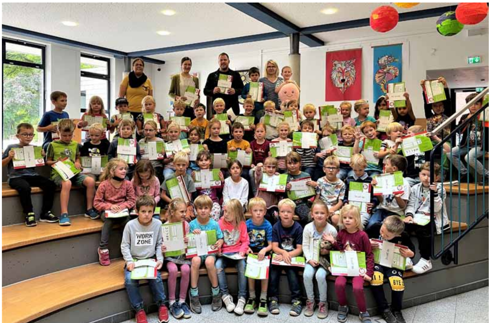
Die Erstklässlerinnen und Erstklässler der Johann-Hinrich-Wichern Gemeinschaftsgrundschule in Sonsbeck freuen sich über Schreiblernhefte von Westenergie

Neben der Energieversorgung engagiert sich Westenergie in ihren Partnerkommunen traditionell in den Bereichen Sport, Kultur, Soziales, Klimaschutz und Bildung. Über Sponsorings und Kooperationen unterstützt das Unternehmen sowohl kleine Initiativen als auch große Vereine, um mit den Menschen vor Ort auch auf gesellschaftlicher Ebene gemeinsam die Zukunft zu gestalten.