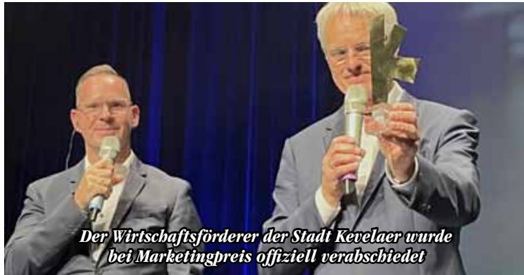
Der Wirtschaftsförderer der Stadt Kevelaer wurde bei Marketingpreis offiziell verabschiedet

Malwettbewerb für Kinder, ein Wettbewerb statt, bei dem der „klimafreundlichste Vorgarten“ innerhalb der jeweiligen Kommunen prämiert wurde. Hilfreiche Tipps zur klima- und insektenfreundlichen Gestaltung eines Vorgartens wurden in einer Broschüre zusammengefasst. Eine siebenköpfige Jury wählt drei Siegerprojekte aus. Die Jury-Sitzung findet Anfang November statt. Die Bekanntgabe der Preisträger erfolgt Ende November. Doch auch die Öffentlichkeit darf einen Sieger wählen: vom 19. September bis zum 31. Oktober 2022 findet eine Online-Abstimmung unter www.dvs-wettbewerb.de/abstimmung statt. Der Publikumspreis geht an das Projekt mit den meisten Stimmen. Die Sieger-Projekte werden zu einer Preisverleihung in festlichem Rahmen eingeladen und geehrt und erhalten Warengutscheine im Wert von 2.000 €, 1.500 € und 1.000 €. Alle teilnehmenden Projekte werden außerdem in einer reich bebilderten Broschüre vorgestellt. Die Broschüre erscheint mit der Preisverleihung und kann danach kostenfrei bestellt werden. Weiterführende Informationen zu dem Wettbewerb und die Möglichkeit zur Abstimmung finden Sie auf der folgenden Internetseite: www.dvs-wettbewerb.de .