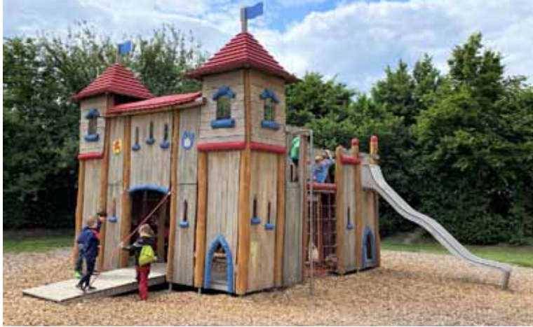
In der neuen Spielplatzroute des Kevelaer Marketings lockt auch die stattliche Ritterburg im Herzen der Ortschaft Kervenheim.

Ein perfekter Familientag in den Herbstferien Kevelaer.