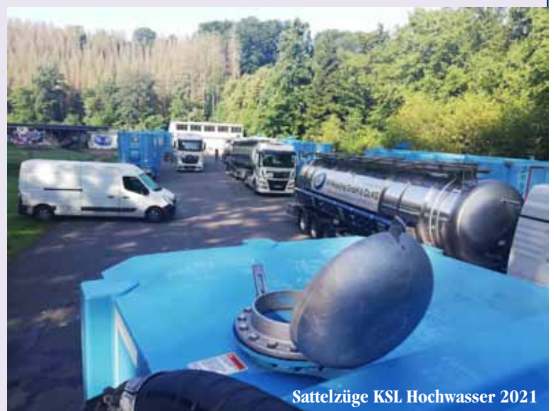
Sattelzüge KSL Hochwasser 2021