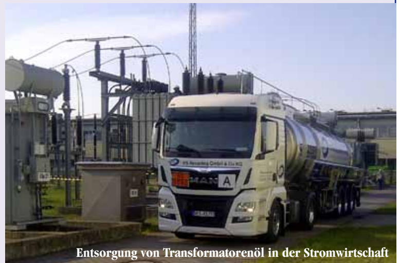
Entsorgung von Transformatorenöl in der Stromwirtschaft