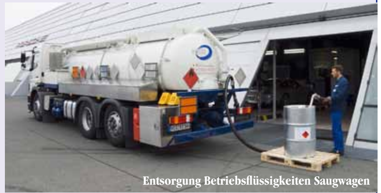
Entsorgung Betriebsflüssigkeiten Saugwagen