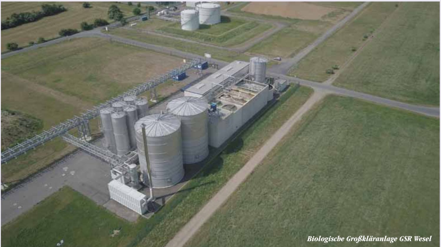
Biologische Großkläranlage GSR Wesel

Neben dem wirtschaftlichen Aspekt für die Binnenschifffahrt - durch die künftige Vermeidung von Umwegen zum Entgasen und Reinigen - hebt der KSR-Geschäftsführer die positiven Folgen für Klima und Rheinanlieger hervor. „Sämtliche Produktionswege im Verbund werden CO 2 -neutral laufen.“ Und der immer wieder auftretende penetrante Abgasgeruch in Flussnähe dürfte nach Eröffnung der Anlage weitgehend der Vergangenheit angehören. „Die Gase aus den Schiffen landen da, wo sie hingehören - und keinesfalls in der Luft.“