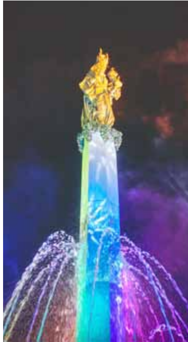
Beeindruckende Illuminationen, musikalische Highlights, verlängerte Öffnungszeiten des Einzelbandels und eine spirituelle, musikalische Lesung zaubern im März eine stimmungsvolle Atmosphäre in Kevelaers Innenstadt.