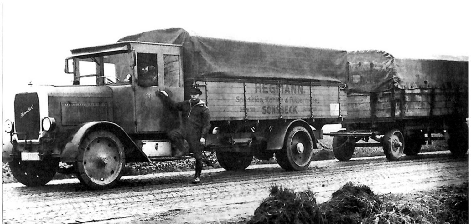
Hegmanns zweiter Wagen, wiederum ein Henschel 6 C, aber technisch „modernisiert“