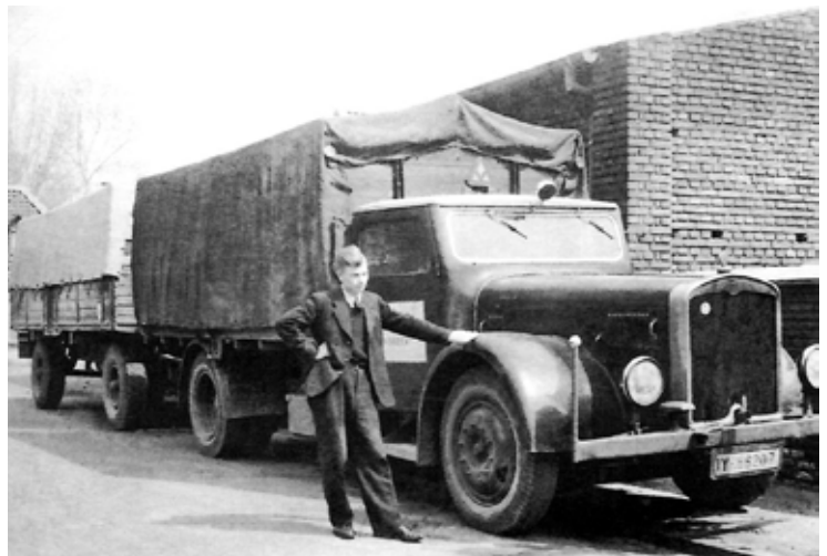
Der 1936 beschaffte Magirus mit 110 PS leistendem Sechszylinder-Diesel. Anfang der vierziger Jahre wird der Wagen auf Holzgasbetrieb umgerüstet.