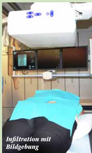
Infiltration mit Bildgebung