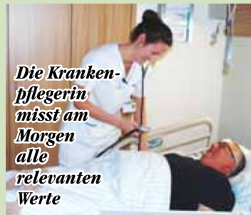
Die Krankenpflegerin misst am Morgen alle relevanten Werte