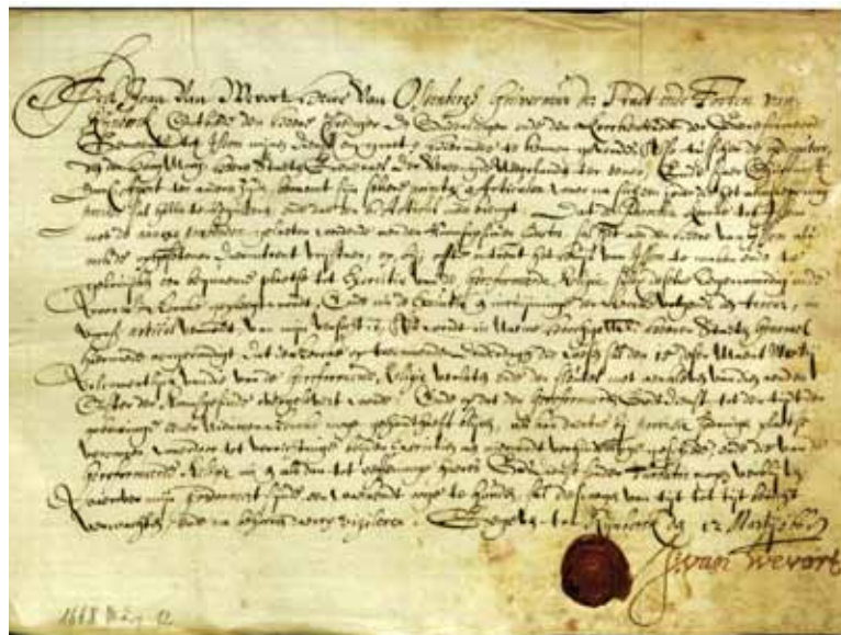
Brief des Gouverneurs von Rheinberg aus dem Jahr 1668, worin er die Protestanten auffordert, die Kirche von Issum innerhalb von drei Tagen an die Katholiken zu übergeben