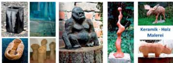
Keramik · Holz Malerei

Zur Eröffnung am 2. Juni 2019 um 11.00 Uhr spielt die Band „Autumn Indigo“ Jazziges