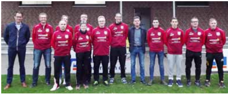
Zum 100-jährigen Jubiläum des SV Sonsbeck hat die Provinzial Geschäftsstelle Giesen & Webren den Trainer- & Betreuer- Stab der Fußballjugend mit neuen Sweatshirts ausgestattet. Somit machen nicht nur die Jungs und Mädels auf dem Platz eine gute Figur