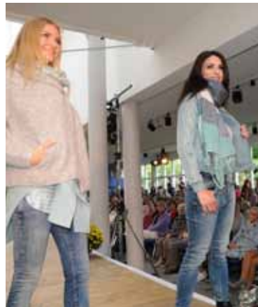
Insgesamt drei Modenschauen mit den Trends der Herbst-/ Winterkollektion finden am 15. September bei der „Kevelaerer Nacht der Trends“ statt

Auch die Geschäfte und Gastronomie in der Innenstadt haben an diesem Abend bis 23 Uhr branchenübergreifend geöffnet.