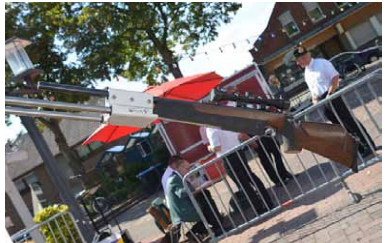
Keiner hat sich getraut, den entscheidenden Schuss zu setzen.