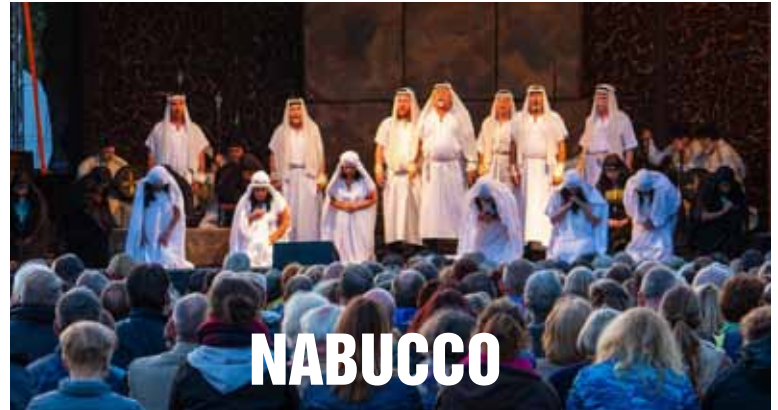
Einen Kunstgenuss der besonderen Art stellte die Open Air-Aufführung der Giuseppe Verdi Oper „Nabucco“ im Xantener Kurpark dar

Einlass ab 18.30 Uhr / Beginn 19.00 Uhr inkl. Currywurst – scharf, schärfer, am schärfsten – mit Brot (all you can eat) und Programm (exkl. Getränke), freie Platzwahl.