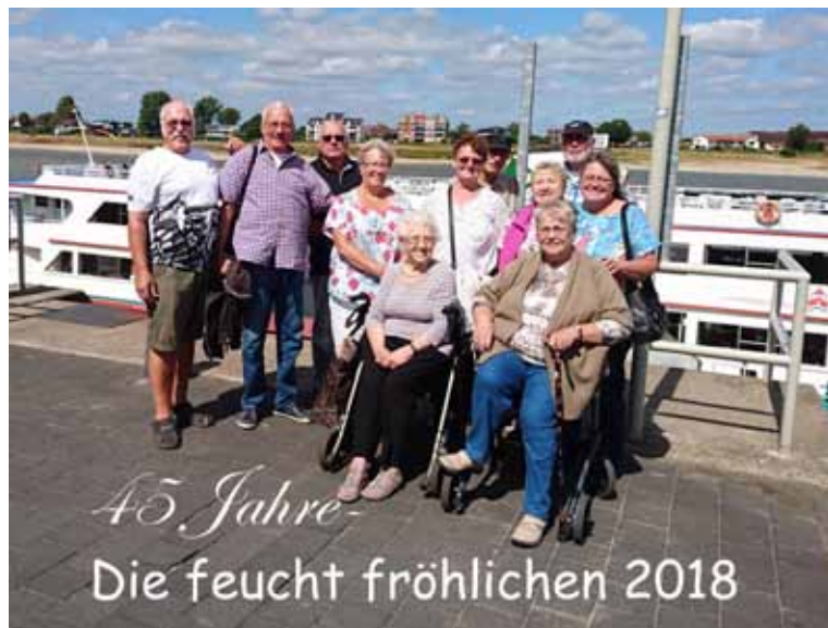
Der gemischte Kegelklub „Die Feuchtfröhlichen“ aus Kapellen machte seinen Jahresausflug mit der Reeser Personenschiffahrt in die Niederlande. Arnheim konnte jedoch wegen Niedrigwasser nicht angefahren werden und man landete in Nijmegen. Dort wurde unter fachkundiger Leitung die Altstadt besichtigt und das 45-jährige Bestehen des Kegelklubs gefeiert