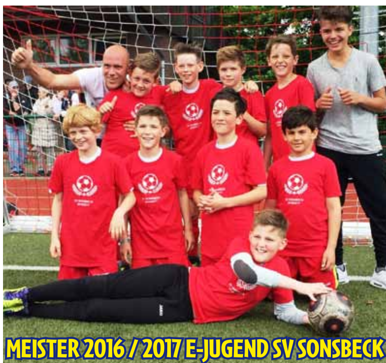
MEISTER 2016 / 2017 E-JUGEND SV SONSBECK