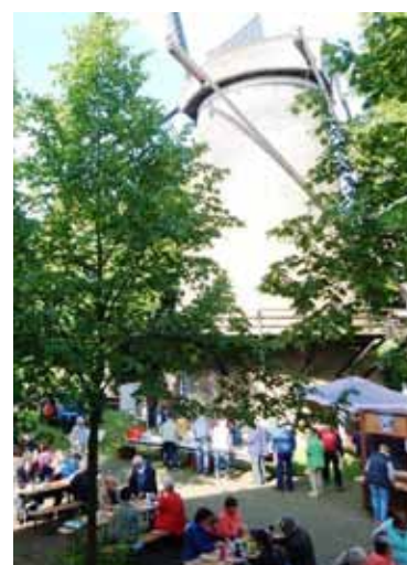
MÜHLENFRÜHSTÜCK 2017 HVV SONSBECK