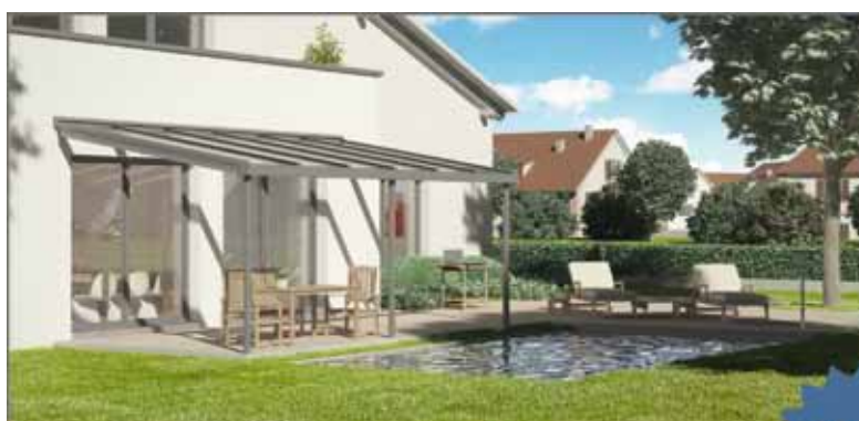
DAS BESONDERE TERRASSENDACH