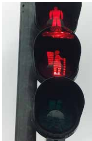
PI Ampelmännchen Einbau-Ampelmännchen 01 2022 (3)